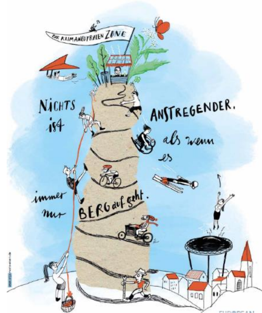
Urheber: Anja-Maria Eisen